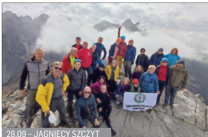
28.09 – JAGNIĘCY SZCZYT