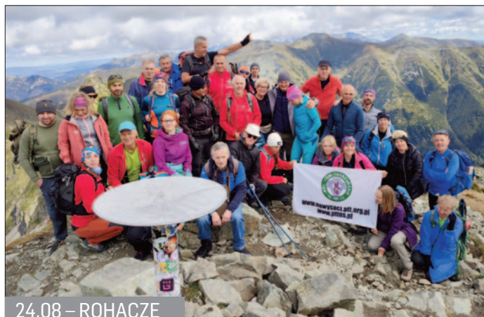
24.08 – ROHACZE