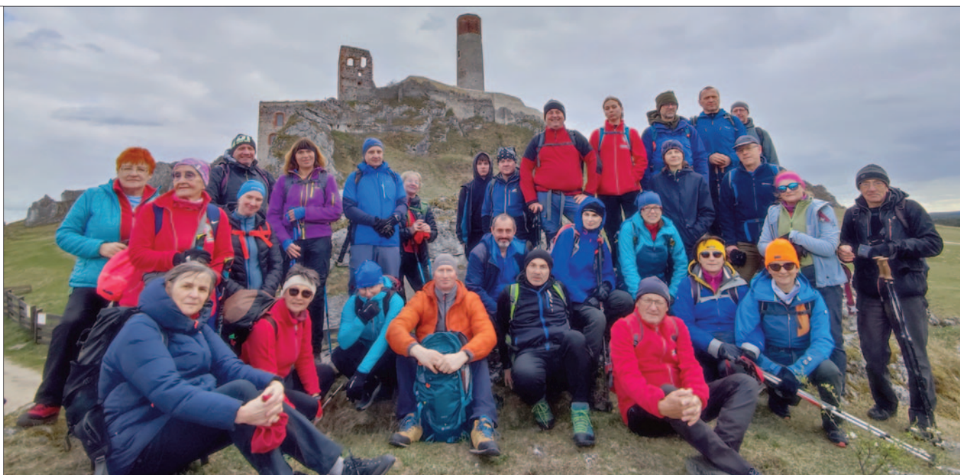
Zamek Olsztyn