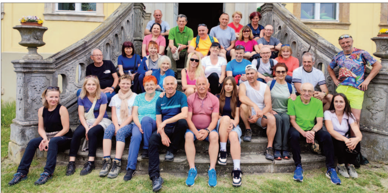
Łupki – Pałac Lenno