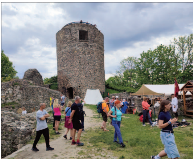
Łupki – Zamek Wleń

mity punkt widokowy. Stąd mamy około 7 km relaksowej wędrówki do Chełmska Śląskiego, w którym połowa mieszkańców wywodzi się z Sądecczyzny, a przez środek miejscowości przebiega ulica Sądecka. W 1945 roku Chełmsko Śląskie utraciło prawa miejskie i do chwili obecnej pozostaje wsią, słynącą przede wszystkim z tradycji tkackich. To właśnie Domy Tkaczy, zwane Dwunastoma Apostołami są najbardziej rozpoznawalnym zabytkiem Chełmska Śląskiego. W jednym z nich mieści się Izba Tkacka, gdzie wysłuchujemy fascynującej opowieści o historii tego miejsca związanego z uprawą lnu i tkactwa. W izbie można zobaczyć jak funkcjonuje kołowrotek