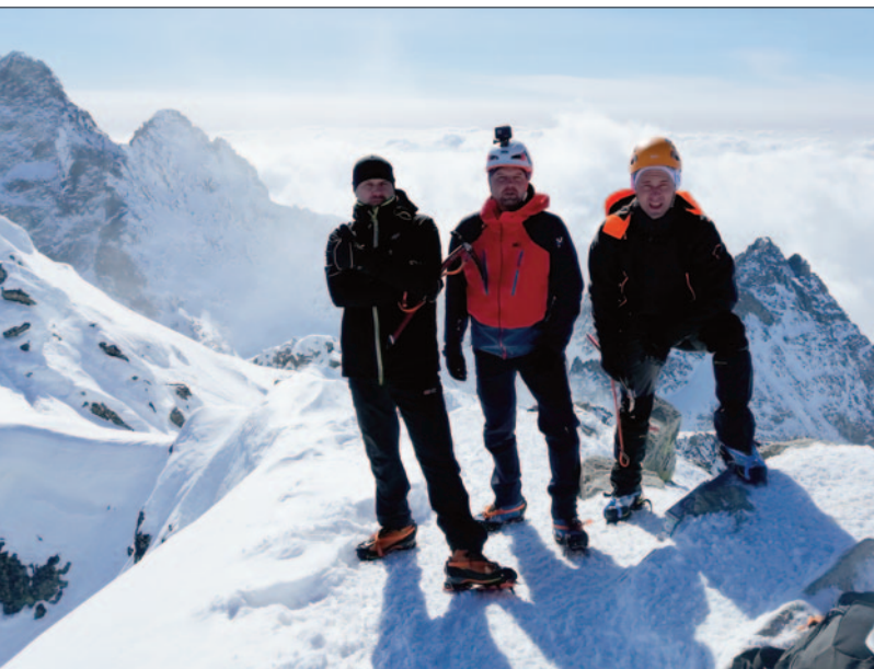
Rysy, 2499 m n.p.m.

Tatry od zawsze były dla mnie czymś więcej niż tylko pasmem górskim widocznym na mapie. To miejsce, które przyciąga, uczy pokory i pozwala odnaleźć ciszę w świecie pełnym pośpiechu. Każda wyprawa w góry była dla mnie małą ucieczką od codzienności, sposobem na złapanie oddechu i zmierzenia się z własnymi słabościami.