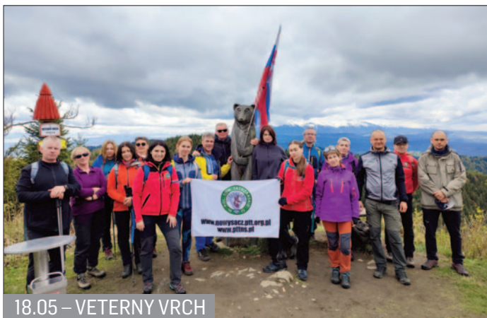
18.05 – VETERNY VRCH