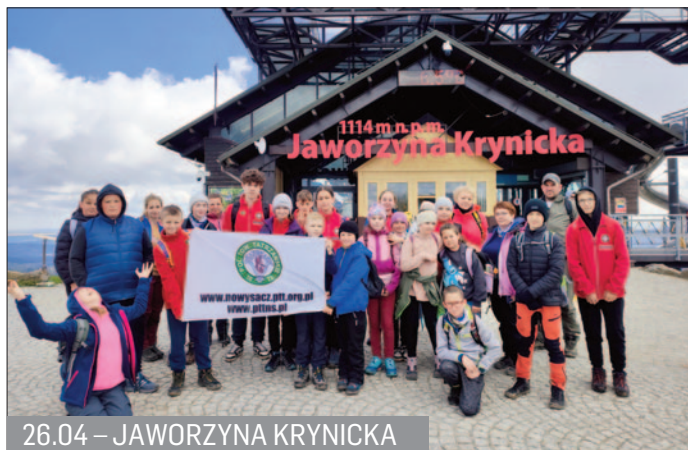
26.04 – JAWORZYNA KRYNICKA