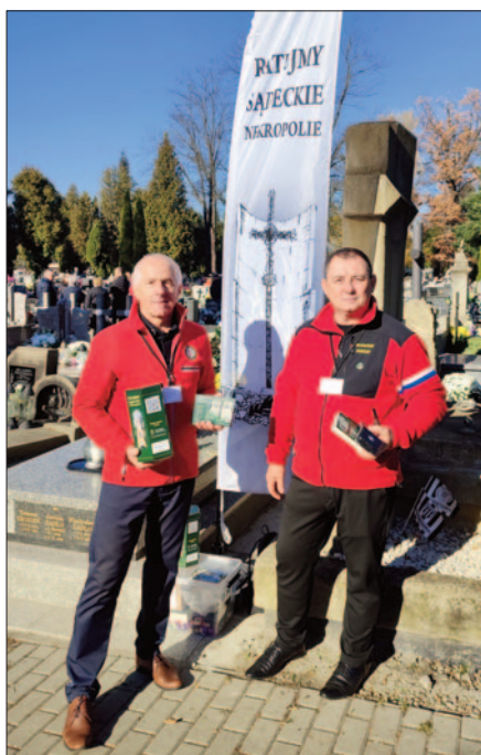
Kwesta Ratujmy Sądeckie Nekropolie