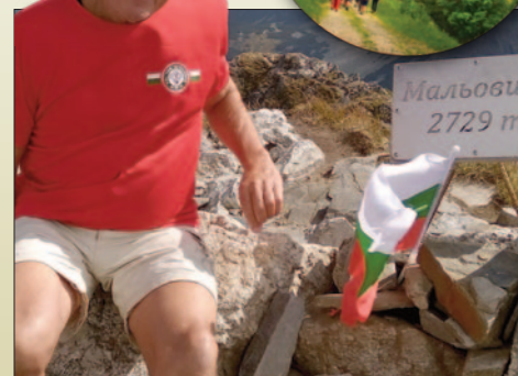
Poznaj naszych przewodników – Ryszard Malesza STR. 33