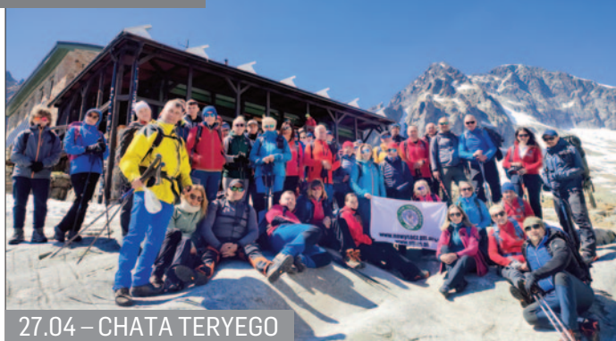
27.04 – CHATA TEREGO