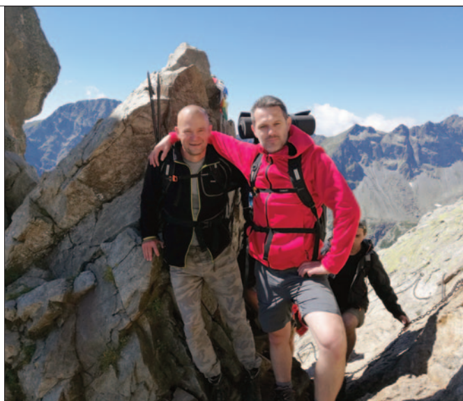
Czerwona Ławka, 2352 m n.p.m.

Każdy sezon w Tatrach przynosił nowe wyzwania. Były dni słoneczne, kiedy szlak wydawał się przyjazny, a panorama zapierała dech w piersiach. Były też takie, gdy deszcz, wiatr czy nagle załamane pogody zmuszały do odwrotu tuż przed celem. W takich chwilach góry uczyły mnie, że nie zawsze liczy się zdobycie szczytu – czasem najważniejsza jest umiejętność rezygnacji i szacunek dla własnego bezpieczeństwa. Z perspektywy czasu mogę powiedzieć, iż najbardziej wymagającym szczytem w ramach TKT było zimowe wyjście na Rysy i cała Orła Perć latem, w kilka godzin, przy temperaturze ponad 30 stopni. Wtedy naprawdę się bałem. Wędrówki na kolejne szczyty Turystycznej Korony Tatr pozwalały mi odkrywać niezwykłą różnorodność tego pasma. Od łagodniejszych, widokowych wierzchołków, po bardziej wymagające trasy, gdzie każdy krok wymagał skupienia. Każdy szczyt miał swój charakter i własną historię. Jedne zachwycały rozległymi panoramami, inne zmuszały do walki z własnym strachem przed ekspozycją czy zmęczeniem. Nie bez znaczenia byli również moi koledzy z ekipy i ludzie spotkani na szlaku. Rozmowy na szlaku, w schroniskach, wzajemne wsparcie na trudniejszych odcinkach czy zwykłe „dzień dobry” wymienione z nieznanymi turystami tworzyły wyjątkową atmosferę górskiej wspólnoty. Wiele z tych spotkań pozostanie w mojej pamięci na długo – bo w górach ludzie często pokazują swoje prawdziwe oblicze.