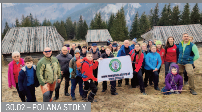
30.02 – POLANA STOŁY