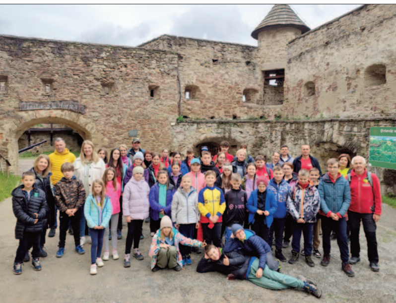
Zamek w Starej Lubowli