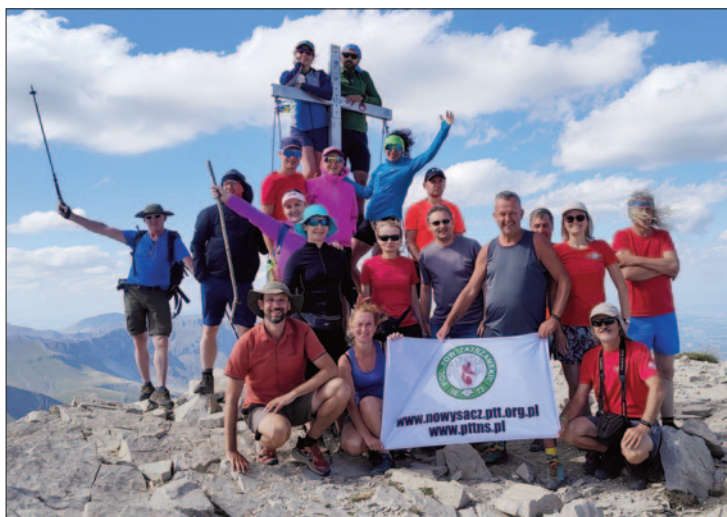
Monte Vettore, Apeniny Włochy

Następnie na cztery noce zadomowiliśmy się nad pięknym, ciepłym Adriatykiem, gdzie – to żadna ściema! – poranki i wieczory upływały na plażowaniu.