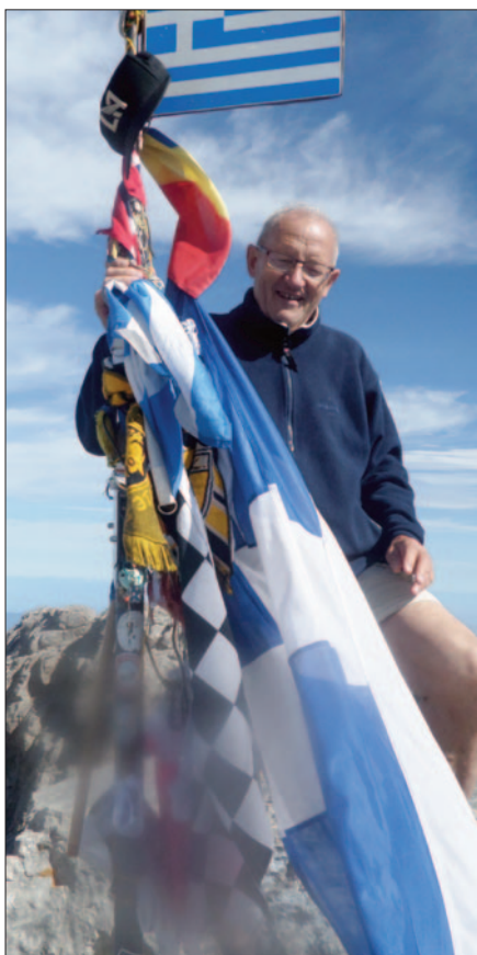
Mitikas, Grecja