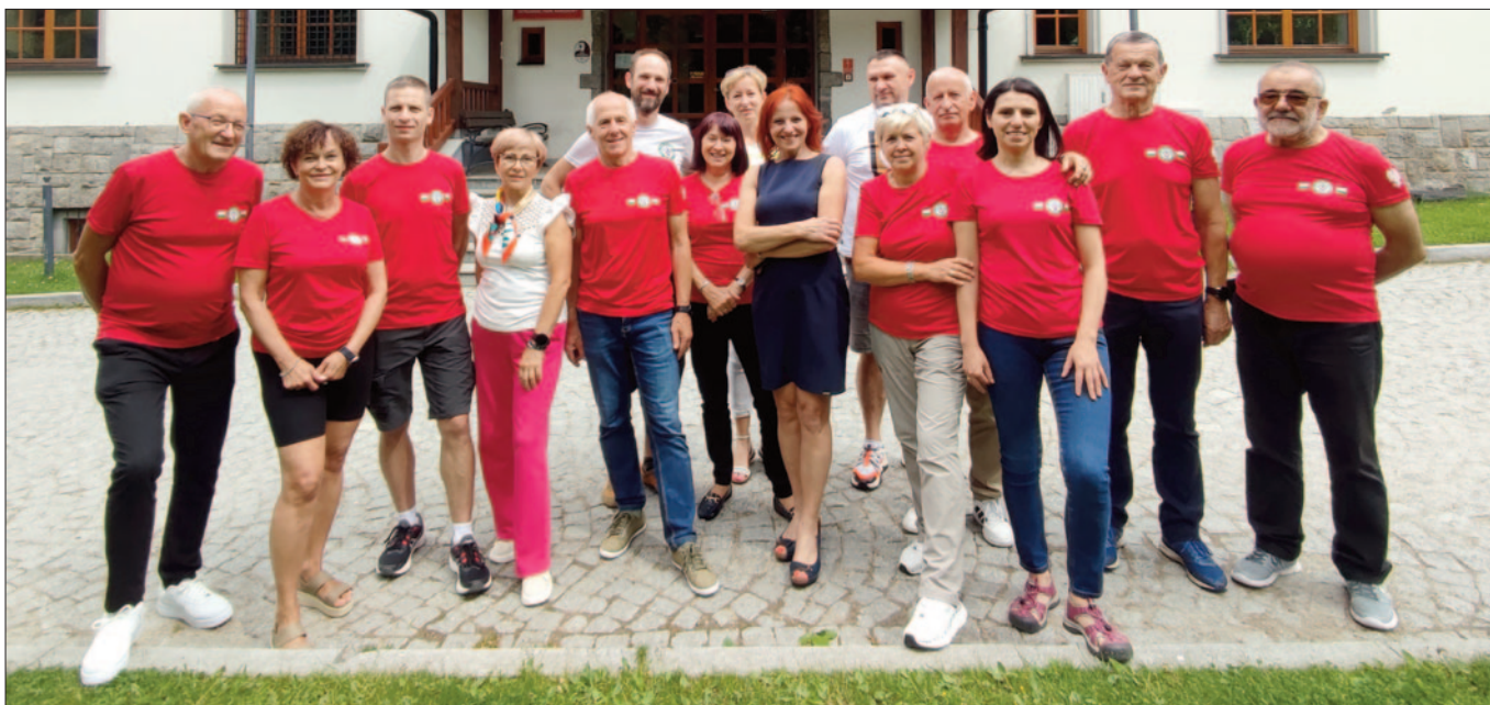
Nasi delegaci na Zjeździe PTT w Zakopanem