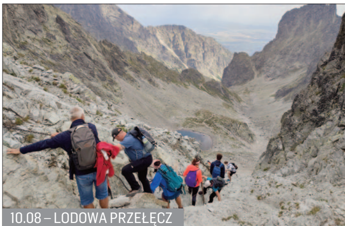
10.08 – LODOWA PRZEŁĘCZ