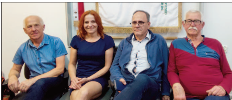
Prezesi PTT Beskid