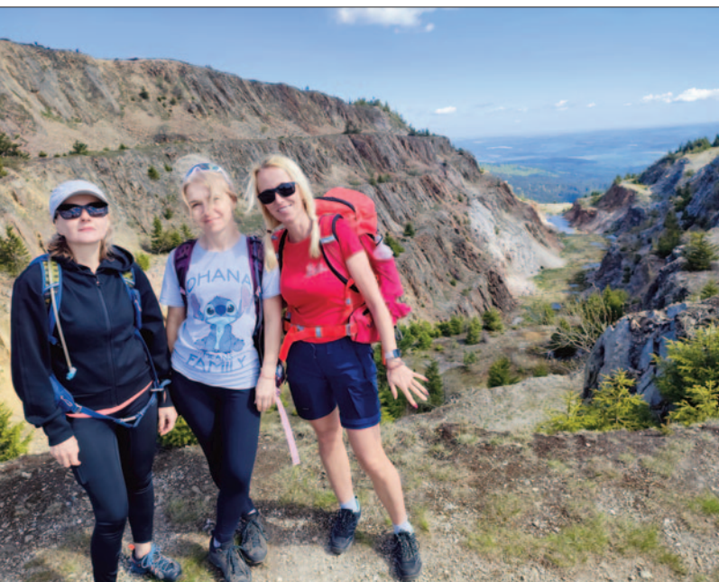
Kopalnia kwarcu Stanisław