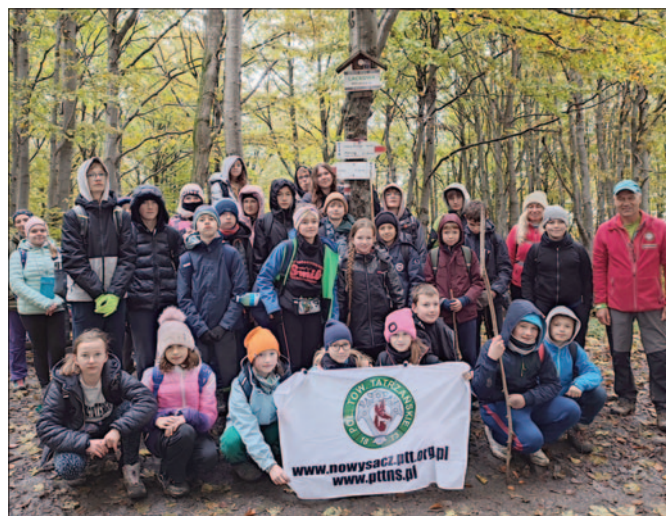
Pierwsza wycieczka – Lackowa