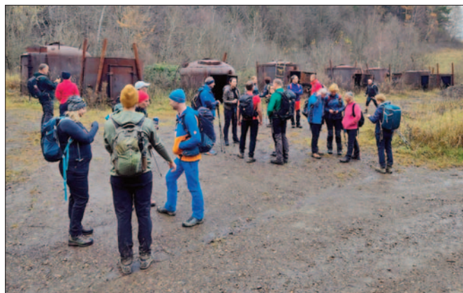
Retorty do wypału węgla drzewnego

Trzeci dzień, to już Wysoki Dział. Dojeżdżamy to Kołonicach przez Przełęcz Hąbkowską i Jabłonki, gdzie jeszcze do niedawna stał pomnik tego, który kulom się nie kłaniał. Może nie kule, ale ustawa dekomunizacyjna IPN dała mu radę. Niemniej jednak kolejny raz trzeba było opowiedzieć trochę o najnowszej historii. To też nawijanie do wspomnianych już wcz-