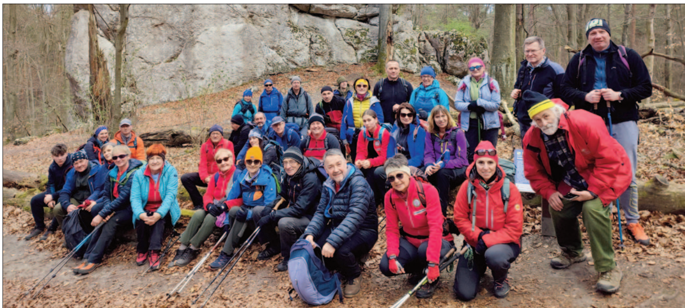
Sokole Góry

Z autokaru, w trybie „zwiedzania przez szybę” ometliśmy chciwym średniowiecznym wzrokiem ruiny zamku we Włodowicach. Dojechaliśmy do zabytkowego cmentarza wojennego w Kotowicach, gdzie spoczywa prawie 1,5 tys. żołnierzy z I wojny światowej – cichy, poruszający przystanek. Potem zmieniliśmy krajobraz na bardziej górski – chodziliśmy po Rezerwacie Sokole Góry. Po drodze skała Bonifacy zaferowała nam widok, jak z folderu – Zamek Olsztyn. Przy ska-