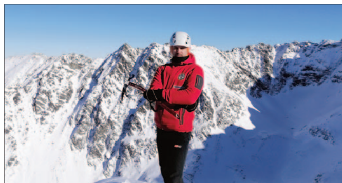
Kościelec, 2155 m n.p.m.

Moja przygoda z Tatrami zaczęła się niewinnie, około 30 lat temu. Początkowo były to krótkie, rekreacyjne wycieczki popularnymi szlakami – Dolina Kościeliska, Morskie Oko czy Gubałówka. Z każdym kolejnym wyjazdem rosła jednak ciekawość, chęć poznawania mniej uczęszczanych tras i wyższych partii gór. Pamiętam chwilę, jak pewnego razu stanąłem z żoną nad Czarnym Stawem pod Rysami, spojrzałem w górę na Rysy i oznajmiłem małżonce – „Powiedz mi kto tam w ogóle chodzi, jak tam można wejść?”. Z biegiem czasu, Tatry zaczęły odsłaniać przede mną swoje bardziej surowe, ale jednocześnie fascynujące oblicze. Pomysł zdobycia Turystycznej Korony Tatr pojawił się w momencie, gdy uświadomiłem sobie, jak wiele szczytów mam już za sobą. Z pozoru proste pytanie: „A może by tak spróbować zdobyć je wszystkie?” stało się początkiem wieloletniego wyzwania. Szybko okazało się, że realizacja tego celu wymaga nie tylko dobrej kondycji fizycznej, ale również planowania, cierpliwości i pokory wobec zmiennej, górskiej pogody.