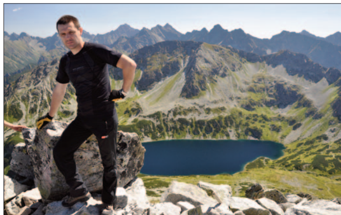
Kozie Czuby, 2266 m n.p.m.

Z czasem zwykłe wędrowki przerodziły się jednak w coś więcej – w marzenie, które z pozoru wydawało się odległe, a nawet nierealne. Tym marzeniem było zdobycie Turystycznej Korony Tatr. Obejmuje ona łącznie 54 tatrzańskie szczyty z drogą dojścia wyznaczoną szlakiem turystycznym oraz 6 wybitnych przełęczy, znajdujących się w pobliżu wierzchołków, na które nie prowadzi żaden szlak. Szczyty i przełęcze wchodzące w skład Turystycznej Korony Tatr znajdują się zarówno po polskiej, jak i słowackiej stronie granicy. Według moich obliczeń, w trakcie realizacji tego przedsięwzięcia, przeszedłem po tatrzańskich szlakach 484 km, co dało 37 928 m przewyższenia. W moim przypadku sukcesywnie zdobywałem kolejne szczyty i przełęcze. Nie występowałem o przyznanie odznaki brązowej po zdobyciu 20 szczytów, czy też srebrnej po zdobyciu 40. Postanowiłem je zdobyć wszystkie i dopiero wtenczas wystąpić o weryfikację na odznakę brązową, srebrną i złotą.