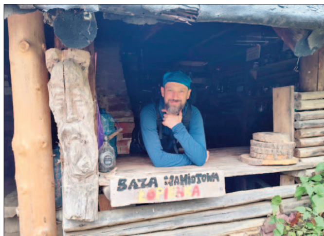
Baza namiotowa Łopienka

Bieszczady 2025 przeszły do historii. Dziękuję wszystkim za udział, a przede wszystkim Piotrkowi, który pilnował żeby nikt się nie zgubił oraz Grześkowi, naszemu kierowcy, któ-