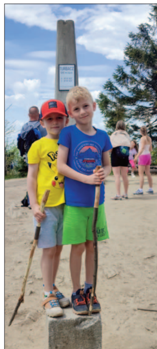
Na szczycie Turbacza

Druga z wycieczek była typowo górską. Zdobyliśmy najwyższy szczyt Gorców – Turbacz, o wysokości 1310 m n.p.m. Ponad 80 uczestników, w tym głównie dzieci z rodzicami i dziadkami, wyruszyło przy pięknej słonecznej pogodzie zielonym szlakiem z Kowańca, z parkingu powyżej Długiej Polany na Osiedlu Oleksówki. Szlak prowadzi początkowo przez las, a wyżej przeplatany jest licznymi polanami z prywatnymi domami i domkami letniskowymi, bowiem tereny od Dunajca aż do schroniska na Turbaczu stanowią własność mieszkańców wsi Waksmund. Mijamy Bukowinę Waksmundzką skąd roztaczają się wspaniałe widoki na Tatry, Pieniny i Jezioro Czorsztyńskie. Następnie przez Wisielówkę, Długie Młaki i strome, ale krótkie podejście dochodzimy do schroniska. Zanim rozgościmy się w nim na dłużej idziemy na szczyt Turbacza, aby mocnym akcen-