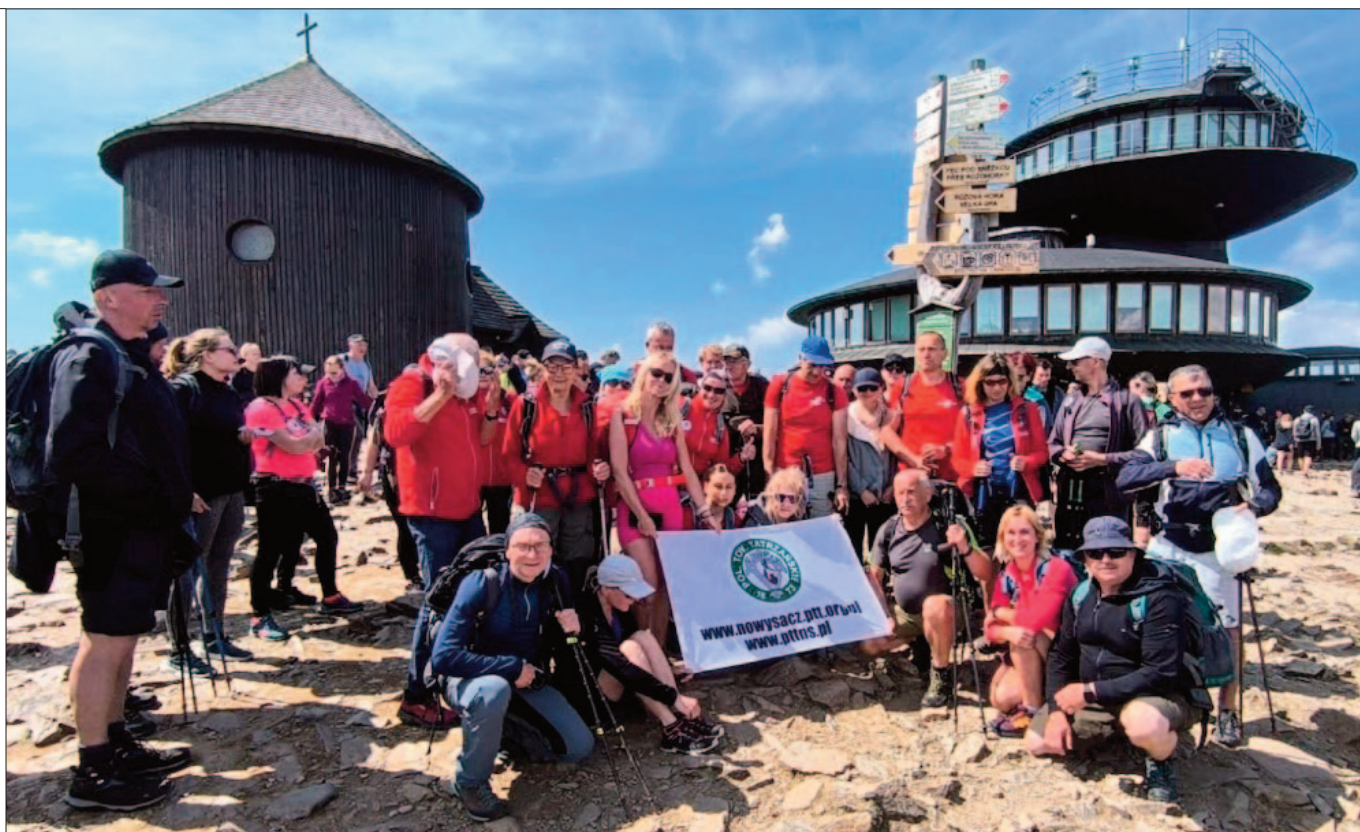
Śnieżka, 1602 m n.p.m.