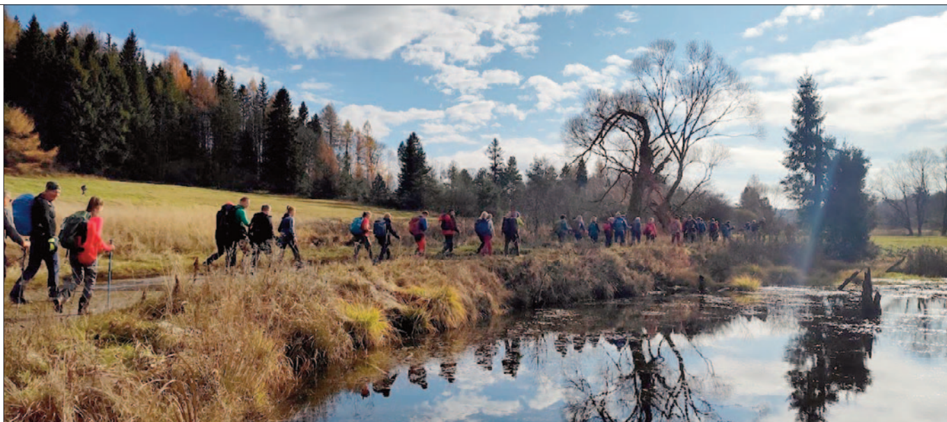
Dolina Jasiela