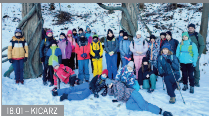
18.01 – KICARZ