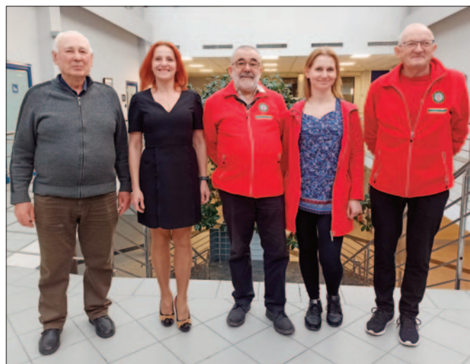
Sąd Koleżeński PTT Beskid