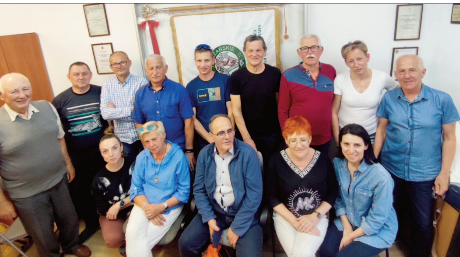
Na otwarciu nowego lokalu

chowska, Góry Choczańskie, Mała Fatra i Niżne Tatry, zimowe i jesienne Bieszczady, Andrzejki na Bereśniku oraz pielgrzymka do Częstochowy.