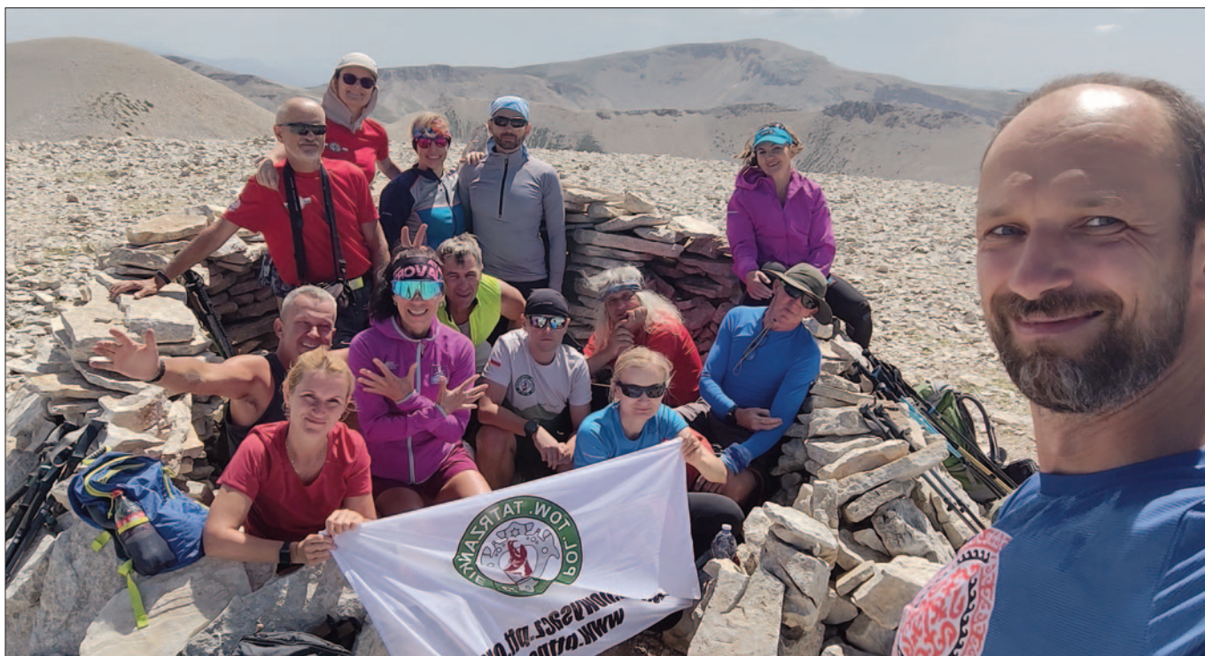
Monte Acquaviva, Masyw Maiella, Apeniny, Włochy

Następnie nadszedł czas na prawdziwy klasyk – Grintovec (2558 m n.p.m.) – najwyższy szczyt Alp Kamnickich, który z miejsca postawił wszystkich do pionu! Ten olbrzym to nie byle góra – przewyższenie niemal 2000 metrów na 6 km, a wejście na niego to prawdziwe wyzwanie. Na szczęście technicznie łatwe. Po drodze zatrzymaliśmy się na dłuższą przerwę w przytulnym schronisku Kojzova Koča, wysoko na Kokrskim Siedlu – idealne miejsce na chwilę oddechu, łyżek wody i złapanie energii przed kontynuacją mozolnego podchodzenia. Po dotarciu na szczyt rozpościerały się