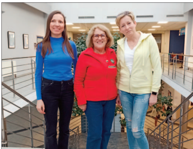
Komisja Rewizyjna PTT Beskid