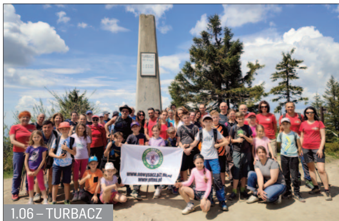
1.06 – TURBACZ