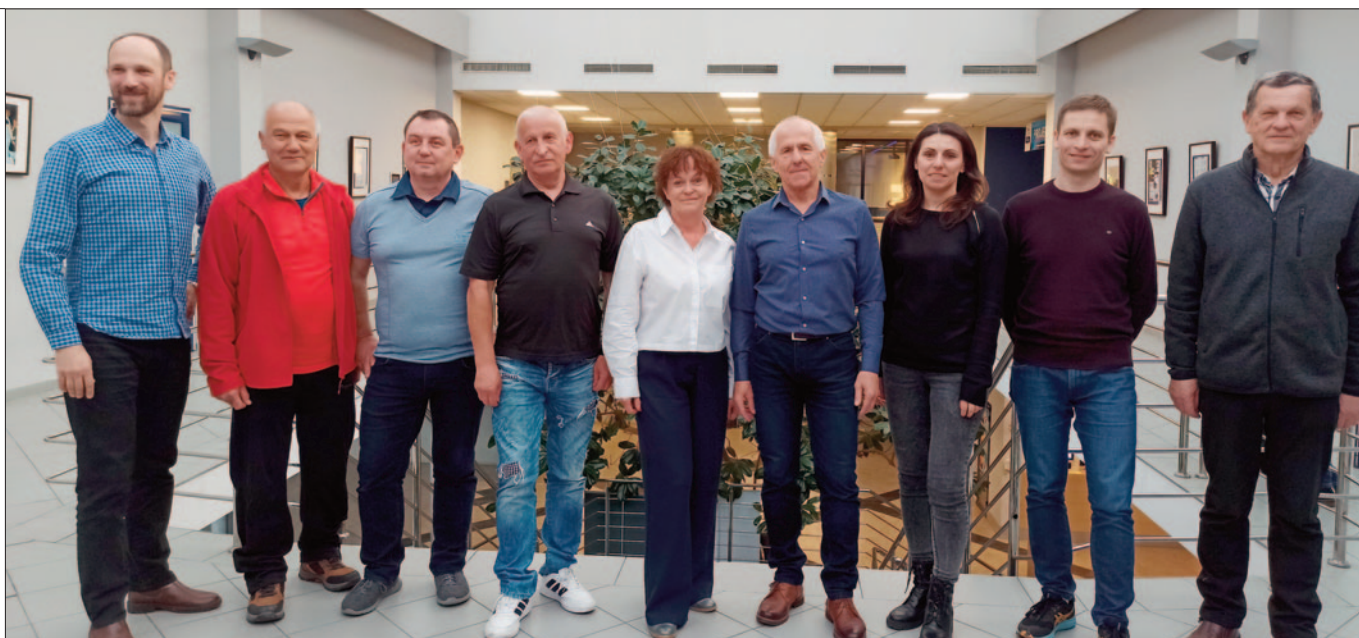
Zarząd Polskiego Towarzystwa Tatrzańskiego Oddział „Beskid” w Nowym Sączu