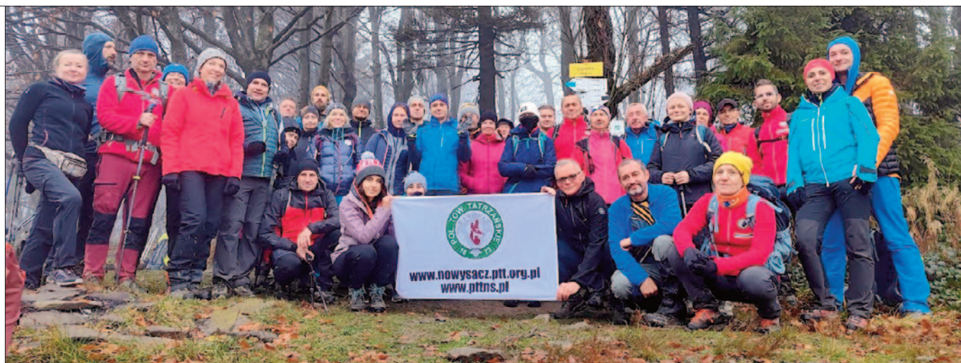
Łopiennik, 1069 m n.p.m.