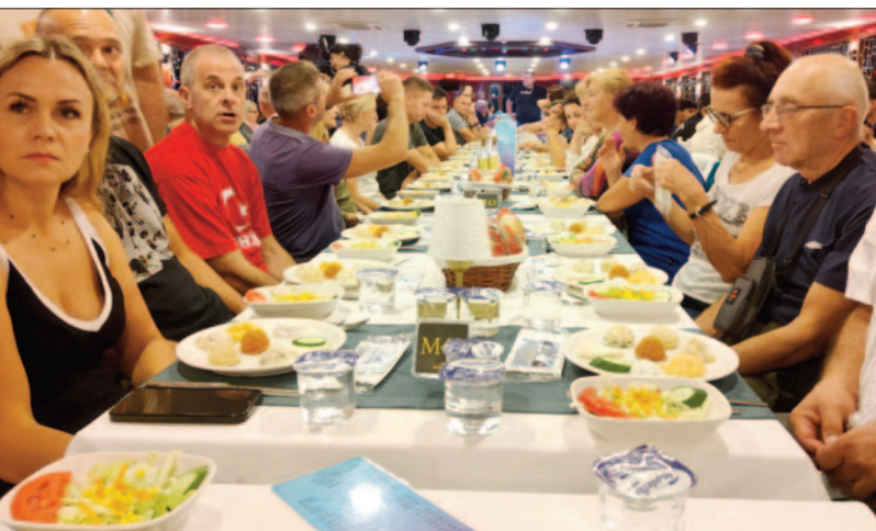
Bosfor rejs