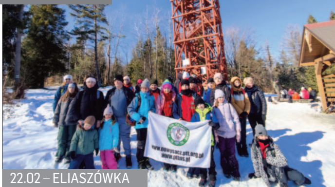
22.02 – ELIASZÓWKA