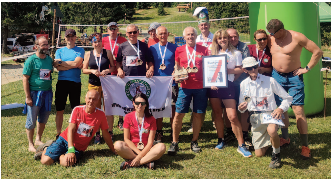
Grupa PTT Beskid na mecie