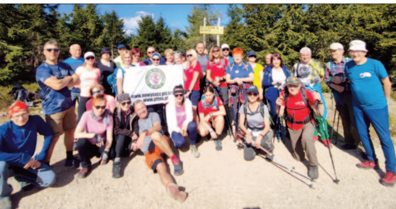
Wysoka Kopa, 1126 m. n.p.m.