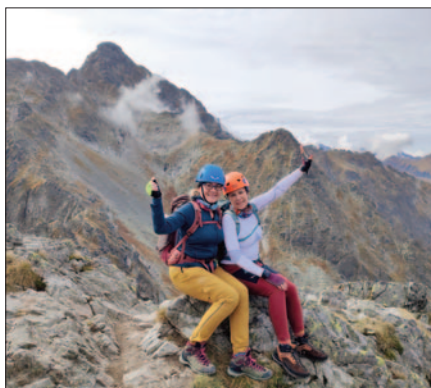
Jagnięcy Szczyt