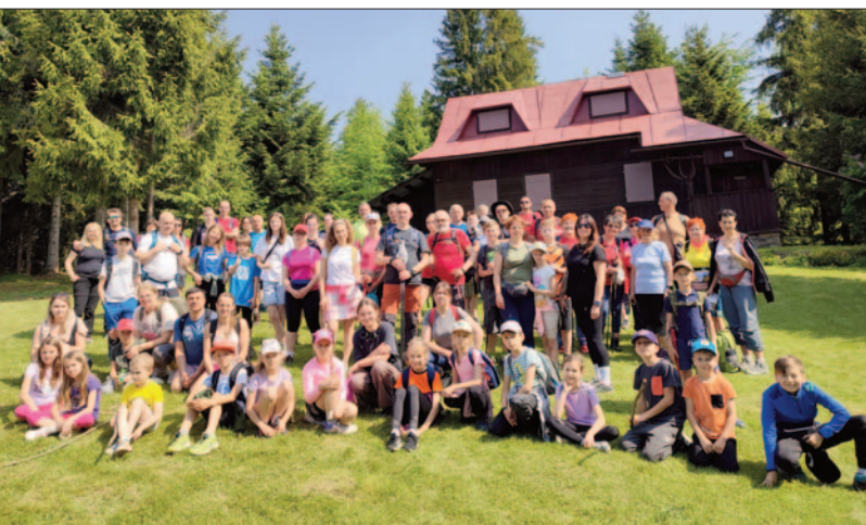
W drodze na Turbacz

Druga z wycieczek była typowo górską. Zdobyliśmy najwyższy szczyt Gorców – Turbacz, o wysokości 1310 m n.p.m. Ponad 80 uczestników, w tym głównie dzieci z rodzicami i dziadkami, wyruszyło przy pięknej słonecznej pogodzie zielonym szlakiem z Kowańca, z parkingu powyżej Długiej Polany na Osiedlu Oleksówki. Szlak prowadzi początkowo przez las, a wyżej przeplatany jest licznymi polanami z prywatnymi domami i domkami letniskowymi, bowiem tereny od Dunajca aż do schroniska na Turbaczu stanowią własność mieszkańców wsi Waksmund. Mijamy Bukowinę Waksmundzką skąd roztaczają się wspaniałe widoki na Tatry, Pieniny i Jezioro Czorsztyńskie. Następnie przez Wisielówkę, Długie Młaki i strome, ale krótkie podejście dochodzimy do schroniska. Zanim rozgościmy się w nim na dłużej idziemy na szczyt Turbacza, aby mocnym akcen-