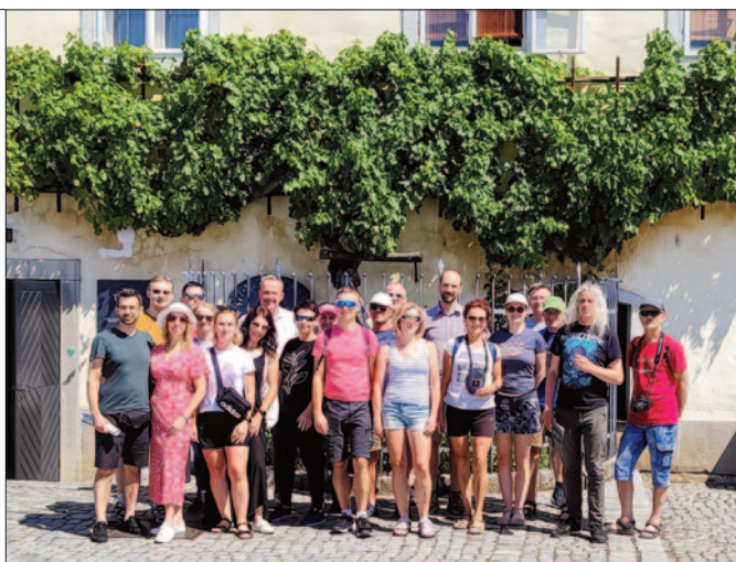
Stara Trta, Maribor, Słowenia