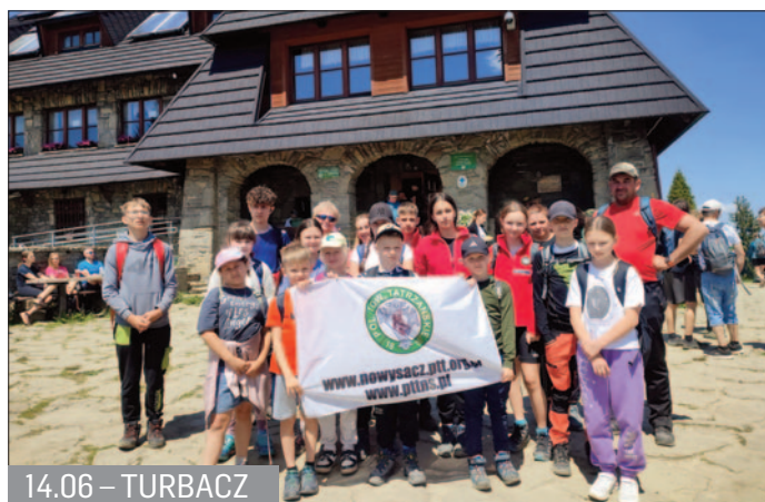
14.06 – TURBACZ