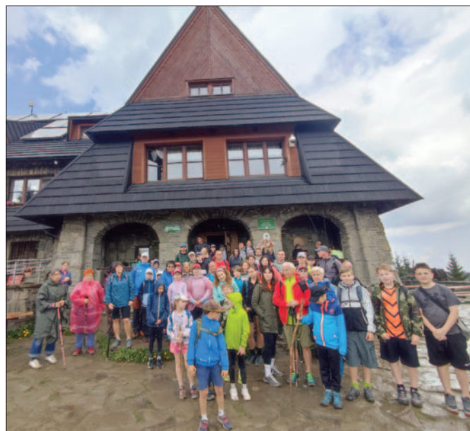
Schronisko na Turbaczu