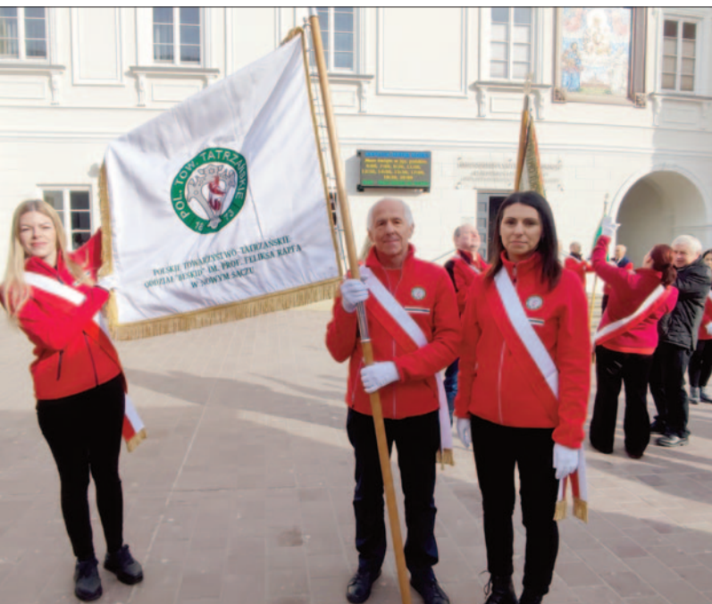
Pielgrzymka przewodników na Jasną Górę