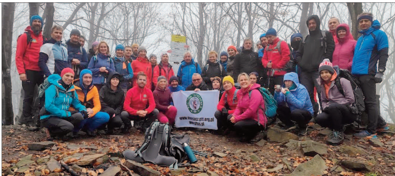
Wołosań, 1071 m n.p.m.

ska Polskiego z UPA, powszechnie znaną jako tragedia w Jasielu, która stała się inspiracją do napisania przez Jana Gerharda książki „Łuny w Bieszczadach”, a także, dwa lata później, jej ekranizacji przez Ewę i Czesława Petelskich w filmie pt. „Ogniomistrz Kaleń”, w którego wcielił się świetny Wiesław Gołas. Swoją drogą część filmu była kręcona w Nowym Sączu. Po ognisku zwartą grupą zdobywamy Kanasiówkę, zwaną również Babą, ze zboczy której biją źródła dwóch dużych rzek – Jasiela oraz Wisłoka. Po pamiątkowym zdjęciu na Kanasiówce schodzimy do Wisłoka Górnego, z którego udajemy się do Kalnicy.