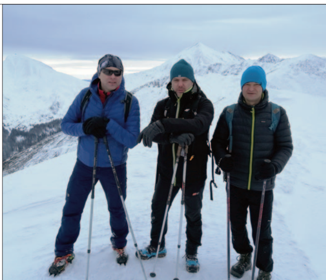
Grześ, 1653 m n.p.m.