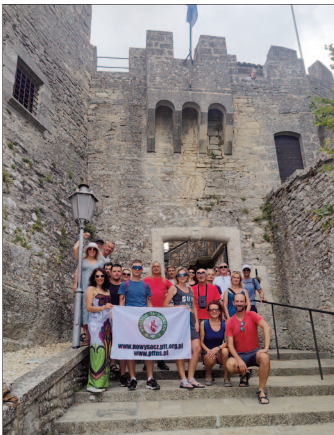
Monte Titano, San Marino

przed nami rozległe, zapierające dech w piersiach widoki, takie, które sprawiają, że wszelki trud i zmęczenie odchodzą w zapomnienie i chce się więcej i wyżej, a jedzenie ciepłego Krakusa smakowało jak prawdziwa uczta.