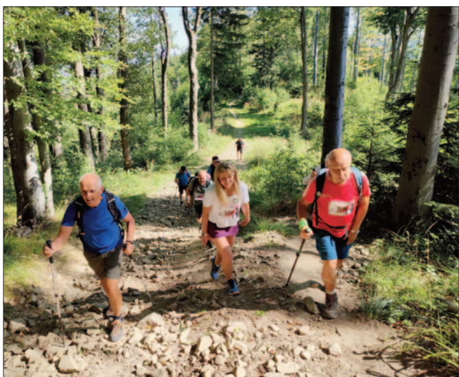
Na trasie rajdu