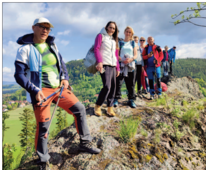
Góry Krucze

mity punkt widokowy. Stąd mamy około 7 km relaksowej wędrówki do Chełmska Śląskiego, w którym połowa mieszkańców wywodzi się z Sądecczyzny, a przez środek miejscowości przebiega ulica Sądecka. W 1945 roku Chełmsko Śląskie utraciło prawa miejskie i do chwili obecnej pozostaje wsią, słynącą przede wszystkim z tradycji tkackich. To właśnie Domy Tkaczy, zwane Dwunastoma Apostołami są najbardziej rozpoznawalnym zabytkiem Chełmska Śląskiego. W jednym z nich mieści się Izba Tkacka, gdzie wysłuchujemy fascynującej opowieści o historii tego miejsca związanego z uprawą lnu i tkactwa. W izbie można zobaczyć jak funkcjonuje kołowrotek