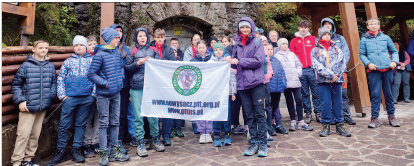
Jaskinia Bielska

Na Dzień Dziecka dla najmłodszych turystów sądeckiego PTT zorganizowaliśmy dwie ciekawe wycieczki. Podczas pierwszej z nich zwiedziliśmy Jaskinię Bielską w Tatrach, odkrytą w 1881 roku, usytuowaną na północnym zboczu Kobylego Wierchu.