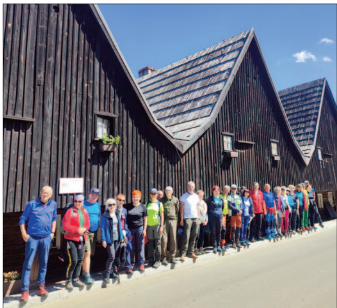
Chetmsko Śląskie-Dwunastu Apostołów

i od zwiedzania Lwówka Śląskiego z jego największymi atrakcjami: dawnym ratuszem, murami miejskimi, Bramą Bolesławiecką, basztą Bramy Lubańskiej, Pałacem Hohenzollernów i samotną Czarną Wieżą, będącą pozostałością po kościele ewangelickim. Tutaj też w kościele Wniebowzięcia NMP – jednym z najstarszych na Dolnym Śląsku, uczestniczymy w mszy św. Rozpoczynając nabożeństwo ks. proboszcz wita grupę z Nowego Sącza, czym jesteśmy mile zaskoczeni.