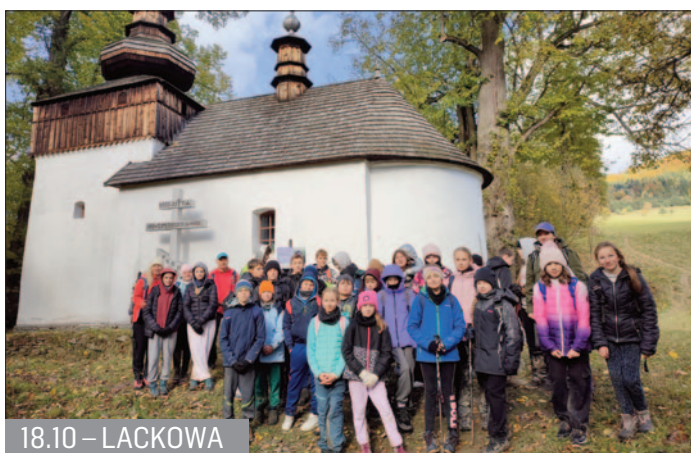
18.10 – LACKOWA