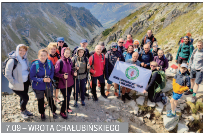
7.09 – WROTA CHAŁUBIŃSKIEGO