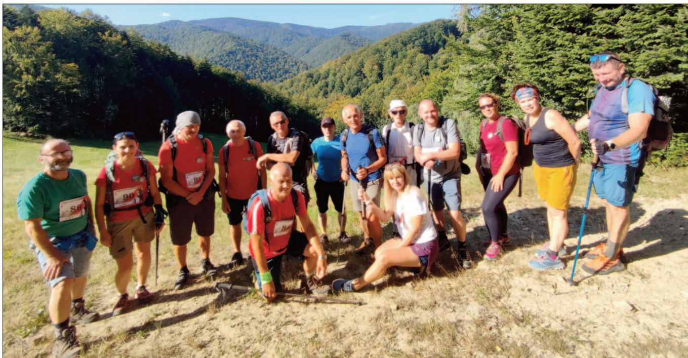
Na trasie rajdu