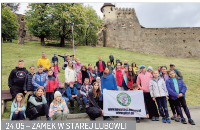
24.05 – ZAMEK W STAREJ LUBOWLI