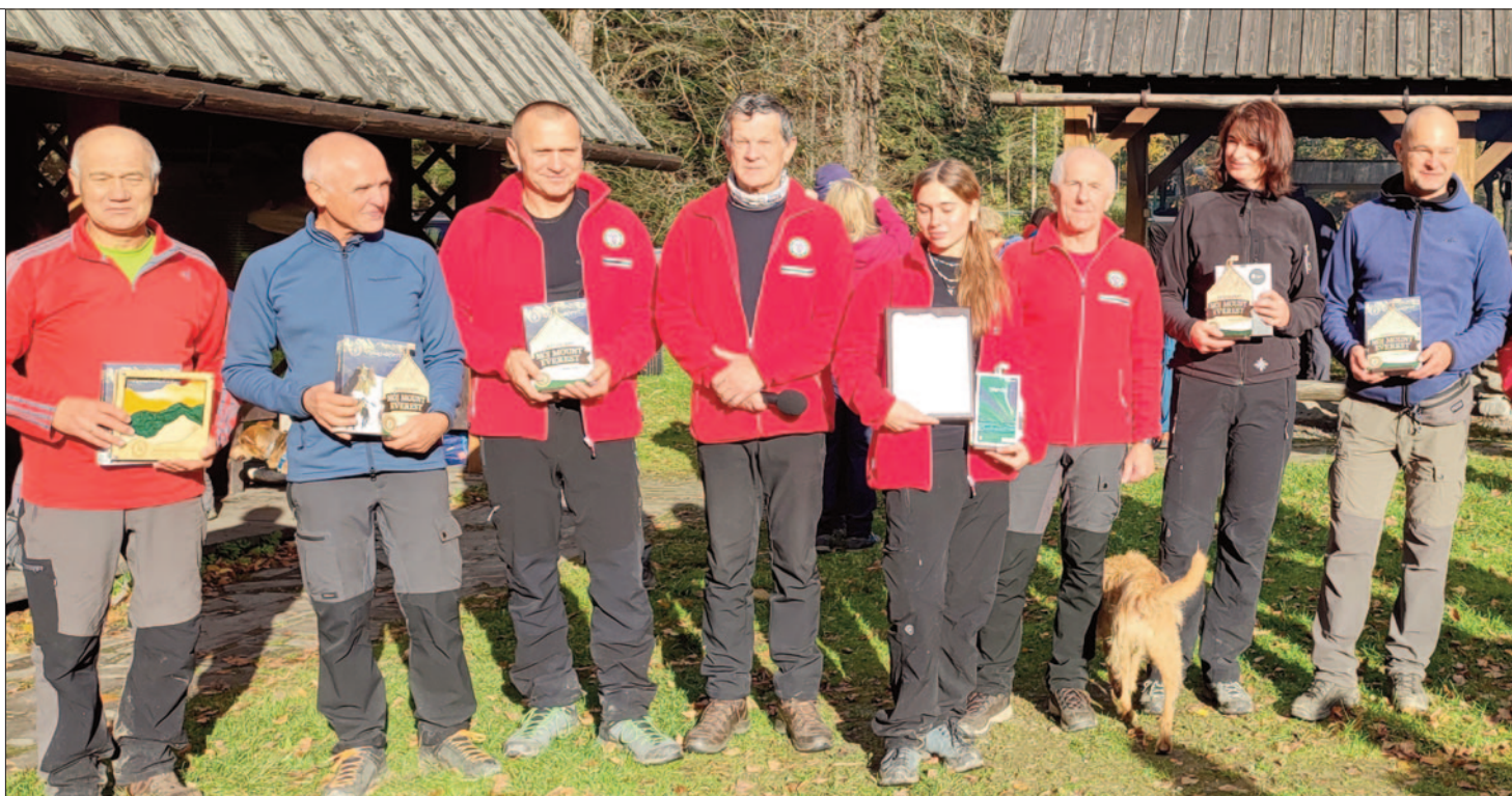
Uczestnicy konkursu Mój Mount Everest