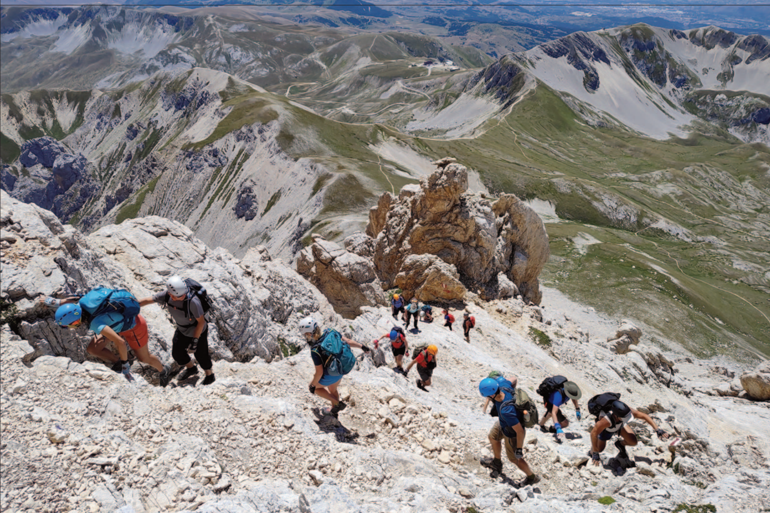
W drodze na Corno Grande Via Direttissima, Apeniny, Włochy

Direttissima, szlakiem absolutnie nie dla mięczaków! Ta trasa, trudniejsza niż nasza słynna Orla Perć, dostarczyła solidnej dawki adrenaliny – strome podejścia i ekspozycje wymagały pełnej koncentracji, ale wiadomo – ile wysiłku, tyle radości z podziwiania widoków! Zdobycie Corno Grande było dla nas prawdziwym momentem chwwały.