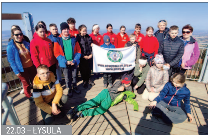
22.03 – ŁYSULA