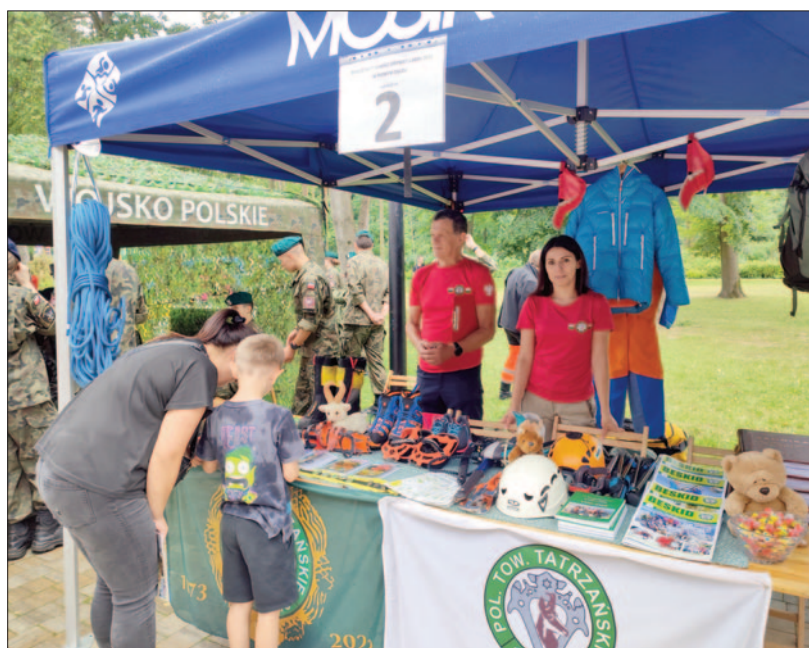
Nasze stoisko na Święcie NGO