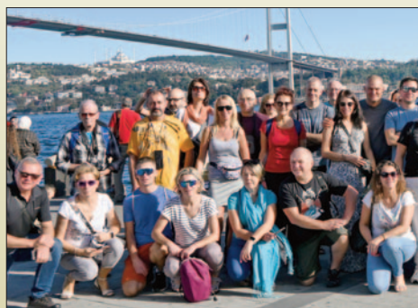
Szlak Winny – Turcja „Trzy stolice imperium” STR. 26