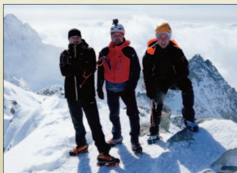
Turystyczna Korona Tatr – moje, spełnione marzenie STR. 12