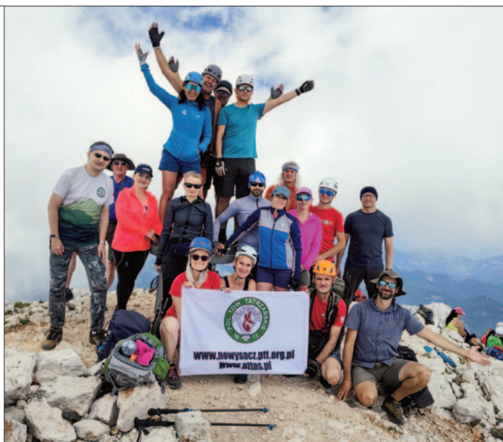
Grintovec, Alpy Kamnickie, Słowenia

Zejscie z Grintovca, w ramach bonusiku, zrobiliśmy granióweczką przez Mały Grintovec, Mlinarskie Sedlo i schron Pavla Kemperla, co można nazwać testem wytrzymałości i umiejętności technicznych bez lęku przestrzeni. Na zejściu sporo piarżysk i żwiru, które dawały solidnie popalić nogom i wymagały czujności... ale kto jak nie my.