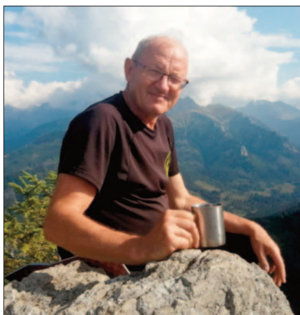
Gęsia Szyja, Tatry

Na wakacje i ferie świąteczne jeździłszy do Zakopanego, ponieważ tam mieszkała ciocia, a wujek oficer praco-